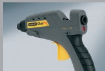
Pistolety klejowe 136